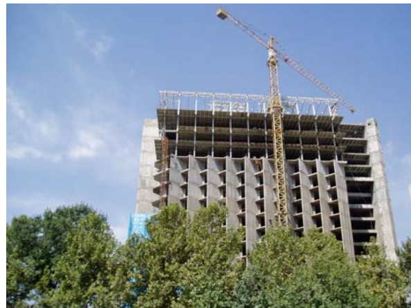
Bild 2: Aufstockung des Südturms